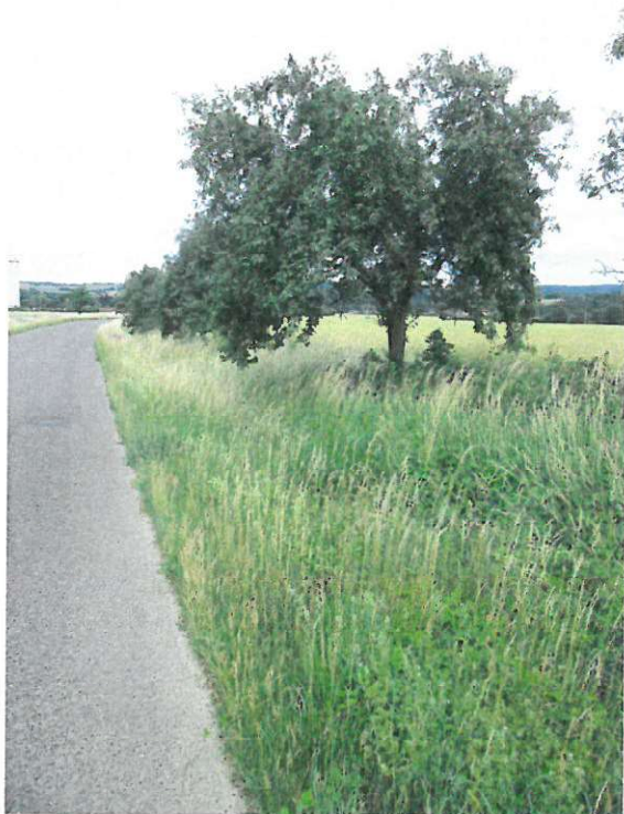
Stromy – č.1-8