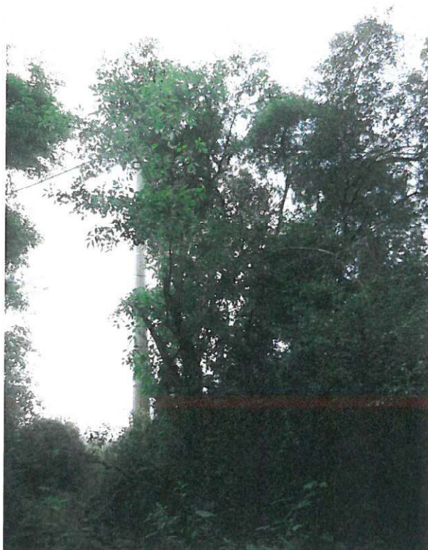
keře – P1