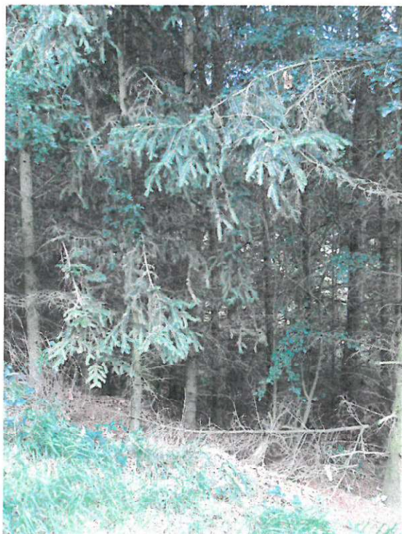
Smrkový porost – P2